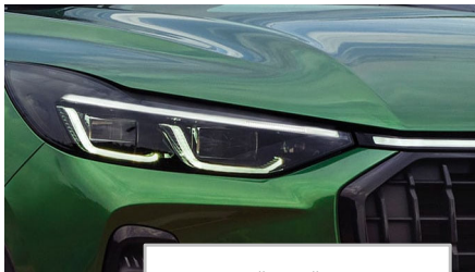
Matrični LED žarometi