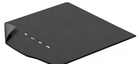
Obojestranski tepih za prtljažni prostor