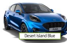
Desert Island Blue