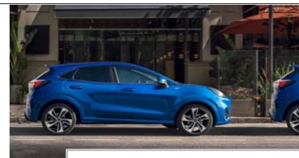
Aktivna pomoč pri parkiranju