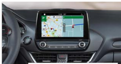
Navigacijski sistem Ford SYNC 3