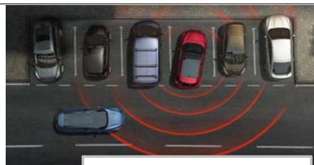
Prepoznavanje prečnega prometa