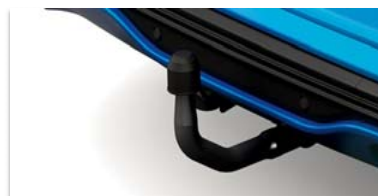
Odstranljiva vlečna kljuka